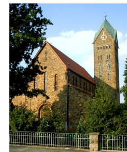
St. Martinus Lindenstraße 28