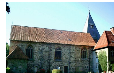
St. Johannes Evangelist Am Kloster, Malgarten

Herzlich willkommen in unserer Pfarreiengemeinschaft der katholischen Kirchen in Bramsche