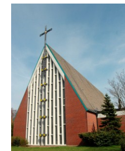
Heilig Geist Westfalenring 5